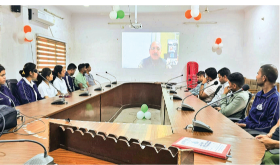
हरिभूमि न्यूज़ ▶ टीकमगढ़