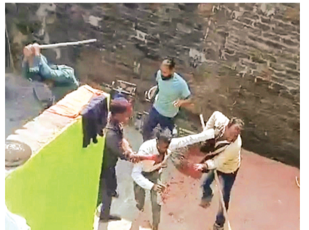
हरिभूमि न्यूज़ ▶ टीकमगढ़

देहात थाना क्षेत्र अंतर्गत ग्राम कंचनपुरा में पानी को लेकर हुए विवाद ने जब हिंसक रूप लिया तब परिजनों ने आपस में ही लाठी डंडों से एक दूसरे की मारपीट कर दी। जिसका वीडियो भी वायरल हुआ। पीड़ित पक्ष की शिकायत के बाद पुलिस ने मामला दर्ज कर लिया है। रविवार सुबह करीब 11 बजे पानी भरने के विवाद पर एक ही परिवार के सदस्य आपस में भिड़ गए। चचेरे माई के परिवार ने दूसरे घर में जाकर बहू-बेटियों को लाठी-डंडों से पिटाई कर दी। उक्त घटना कंचनपुरा गांव में हुई, जिसमें एक पक्ष के चार लोग घायल हो गए।